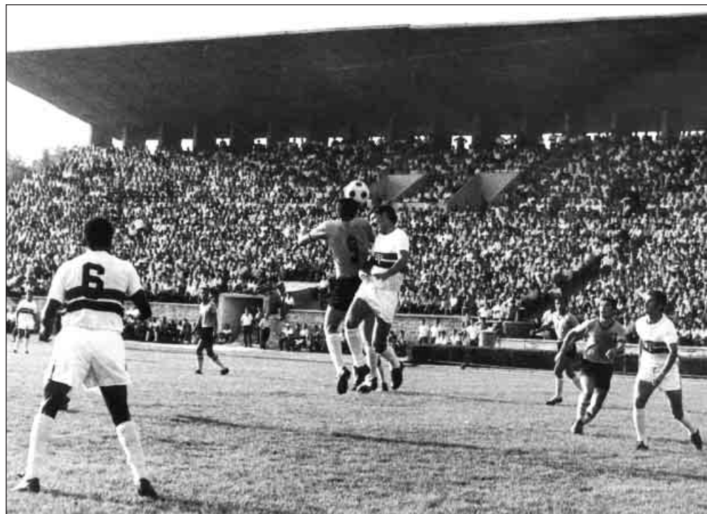
„Виолетовите“ срещат бразилския гранд „Сао Пауло“ пред пълни трибуни на стадион „Ивайло“.