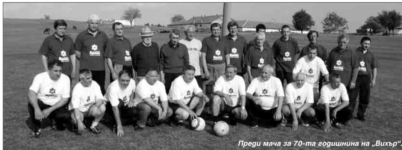
Преди мача за 70-та годишнина на „Вихър“.