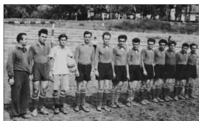
Отборът, спечелил околийската купа през 1955 г.