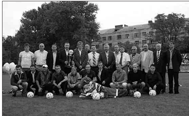
Преди година и половина „Ворскла“ отбеляза 10-годишнината от спечелените бронзови медали.