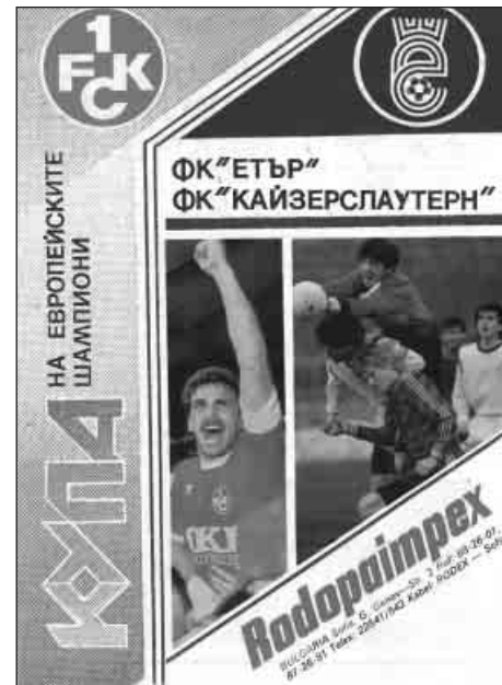
Книжката, издана специално за мача с германците.

можността поне да запише първа победа в евротурнирите в своята история.