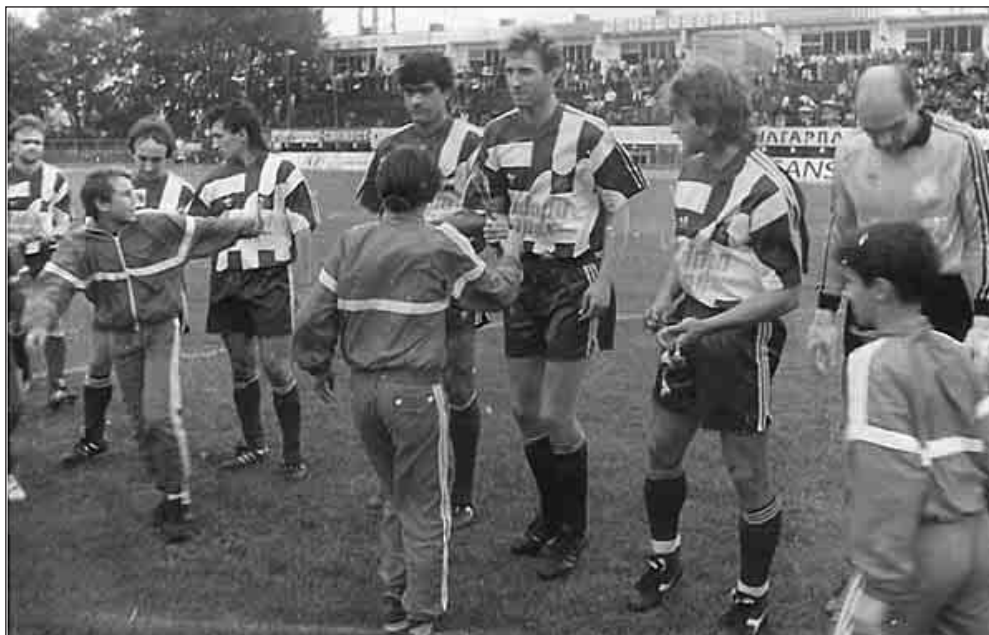
„Етър“ преги мача с „Кайзерслаутерн“ на стадион „Ивайло“.

но. Витанов насочва топката в опразнената врата, но в последния момент защитникът Шефер чисти от самата голлиния.