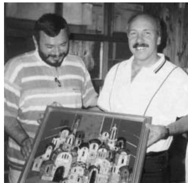
Георги Василев с наградата за Треньор №1 на XX век, връчена му през 2001 година.